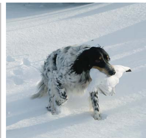
Mac kommer stolt med ripan i munnen efter en snygg fågeltagning.

Vi jagar vidare under en strålände sol som dessvärre försvinner när vi rundade Hovärken. Men i stället kommer vi i lä för vinden. Riporna ligger oftast på läsidan,